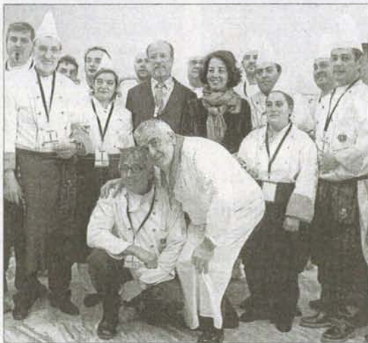
De la Riva y Cantalapiedra con los cocineros participantes. / ICAI