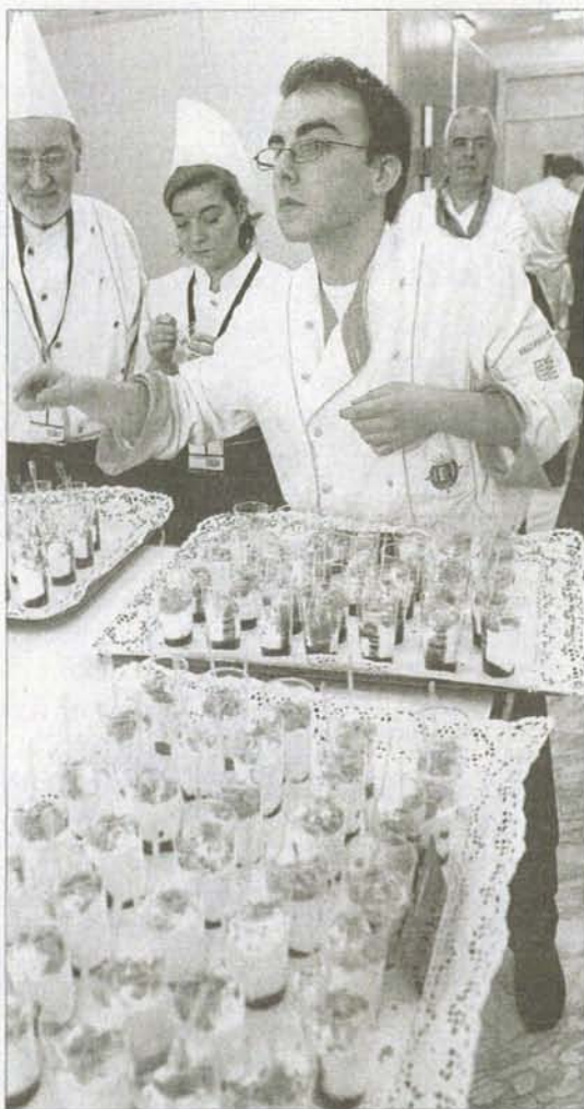
Cada cocinero de Valladolid preparó 800 pinchos o cazuelitas.

Como en años anteriores, los pinchos, tapas y raciones servidos de manera altruista por los restauradores se dividieron en cuatro categorías: seis pinchos fríos, cuatro calientes, siete guisos y cuatro postres, una fórmula con la que los fogones vallisoletanos parecen haber encontrado el éxito en Madrid Fusión. Para alegrar el paladar, las viandas se regaron con los vinos de las bodegas Museum, Prado Rey, Matarrómera, Valdelosfrailes, Abadía Retuerta, Alberto, Elías Mora, Emilio Moro, Cepa 21, Yllera, Dehesa de los canónigos, Portia, Pesquera, Familia y Mocén.